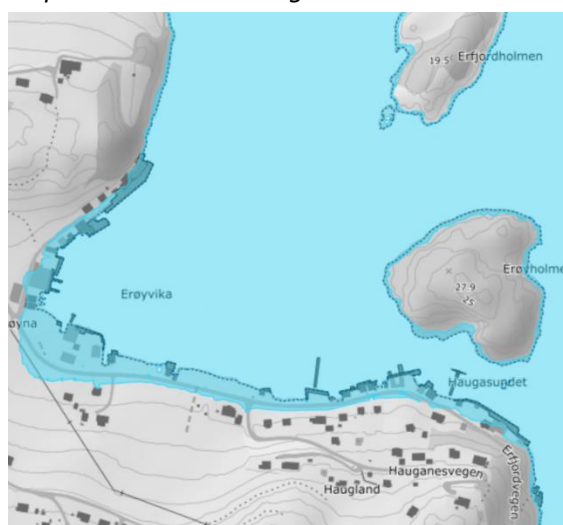
Oversvømte områder ved 200 års stormflo 2090 Erøy