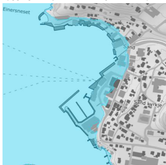
Oversvømte områder ved 200 års stormflo i 2090 Sand

Kommunen vurderer at føresegner for å ta gode val om overvasshandtering og føresegner for bygging over flaumsona er gode tiltak på kommuneplannivå mot hendingane