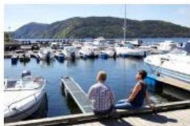
Medverknad og innspel til arbeid med ny kommuneplan 2022-2034

Det har vart nedsett ei arbeidsgruppe i administrasjonen for å arbeid med både kommuneplanens samfunnsdel og arealdel. Styringsgruppa for samfunnsdelen er formannskapet og styringsgruppa for arealdelen er Utvalet for landbruk, miljø og teknikk (LMT-utvalet).